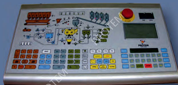
Κονσόλα αυτοματισμού AUTO-LEADER 3000P